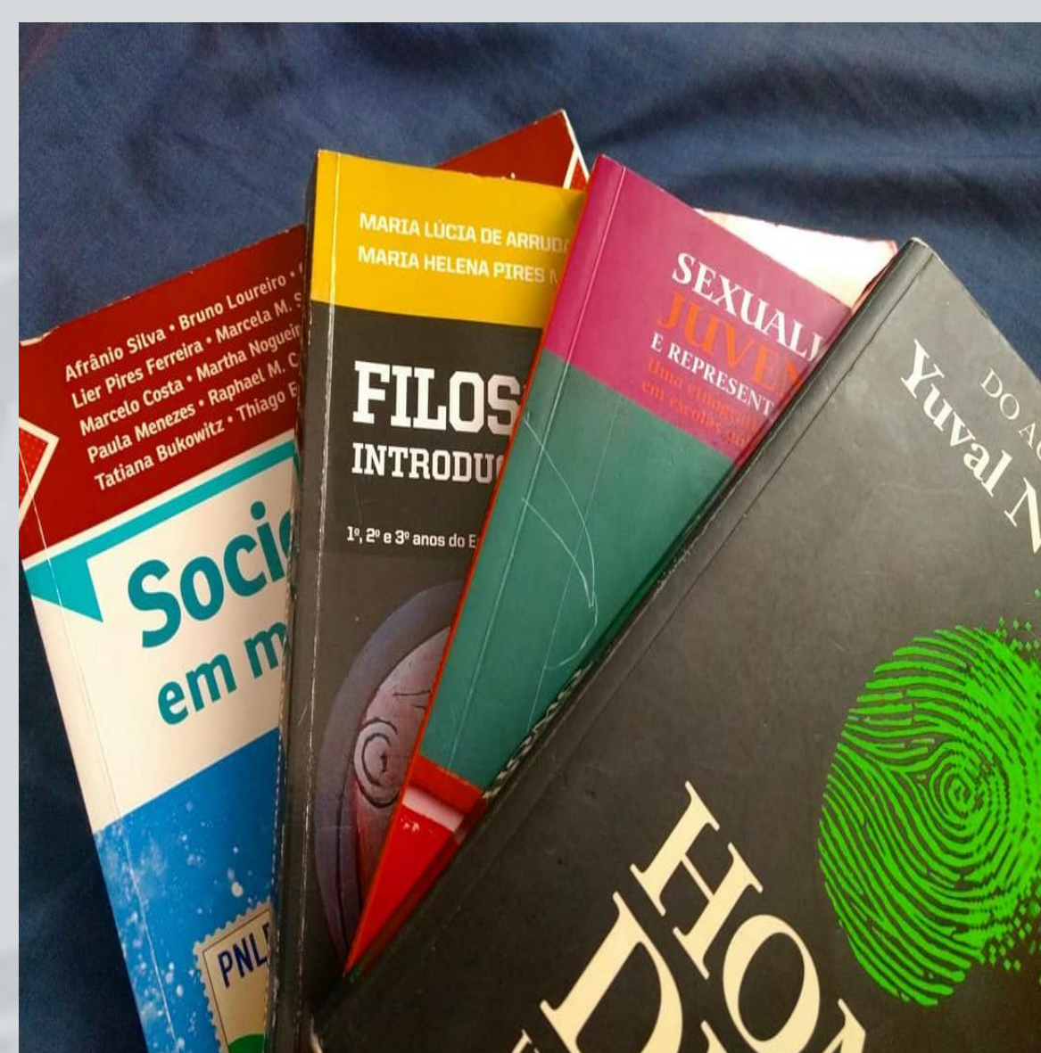
Livros didáticos dados aos estudantes na escola.