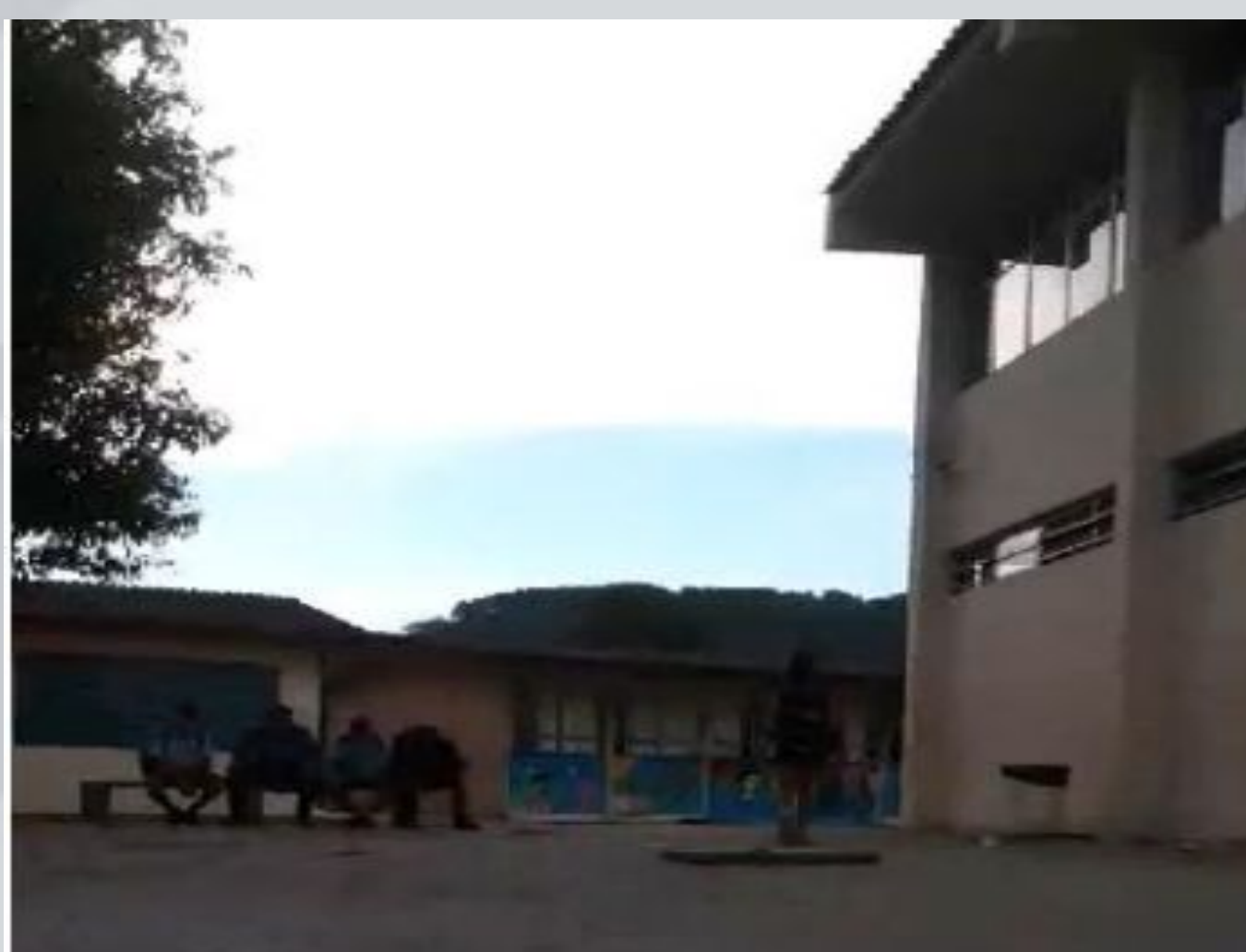
PÁTIO DA E.E.B.N.S.C.

Observação dos espaços da escola, como: pátio, a sala de aula, aula de educação física. Leituras sobre gênero.