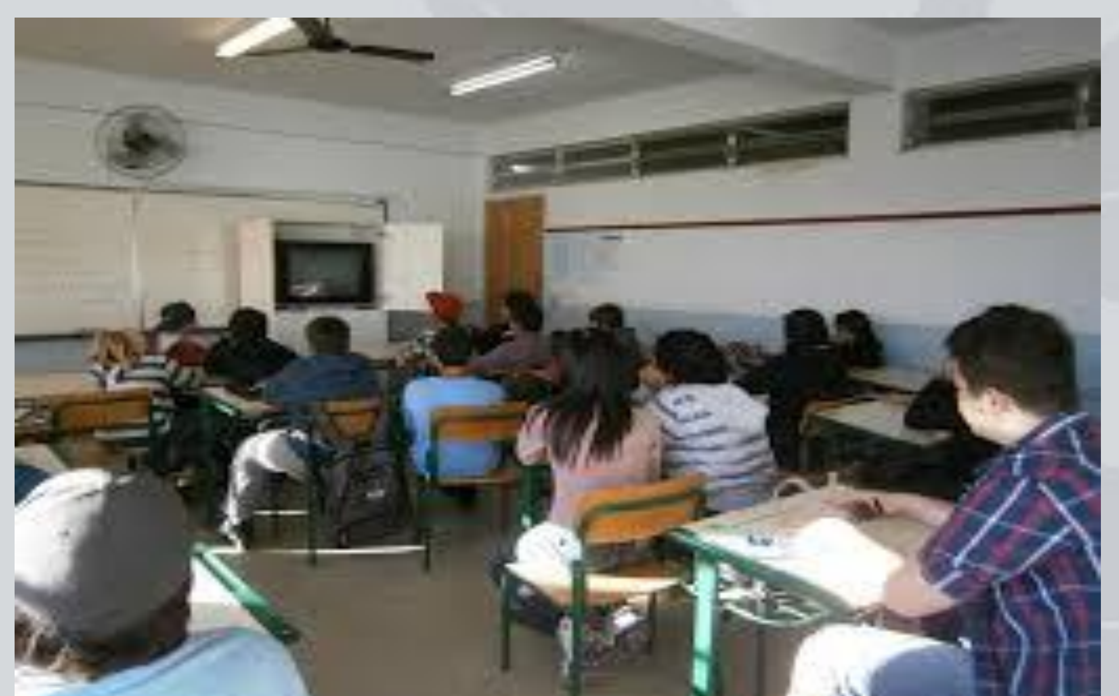
SALA DE AULA DA E.E.B.N.S.C.DURANTE A APRESENTAÇÃO DE UM FILME

Relacionando com a minha segunda observação, por ela ser uma professora nova no colégio e ele um professor de matemática e antigo no colégio, ela não tinha tanto "poder" quanto ele sob os/as estudantes, desse modo, quando trata-se de um professor homem na sala os/as estudantes agem diferente, obedecem e não ficam com as mesmas brincadeiras, nem conversando e prestam muita atenção no que ele fala. Em suma, a escola não pode reforçar essas categorias, precisa estimular os/as estudantes a respeitarem os/as professores/as independente do gênero.