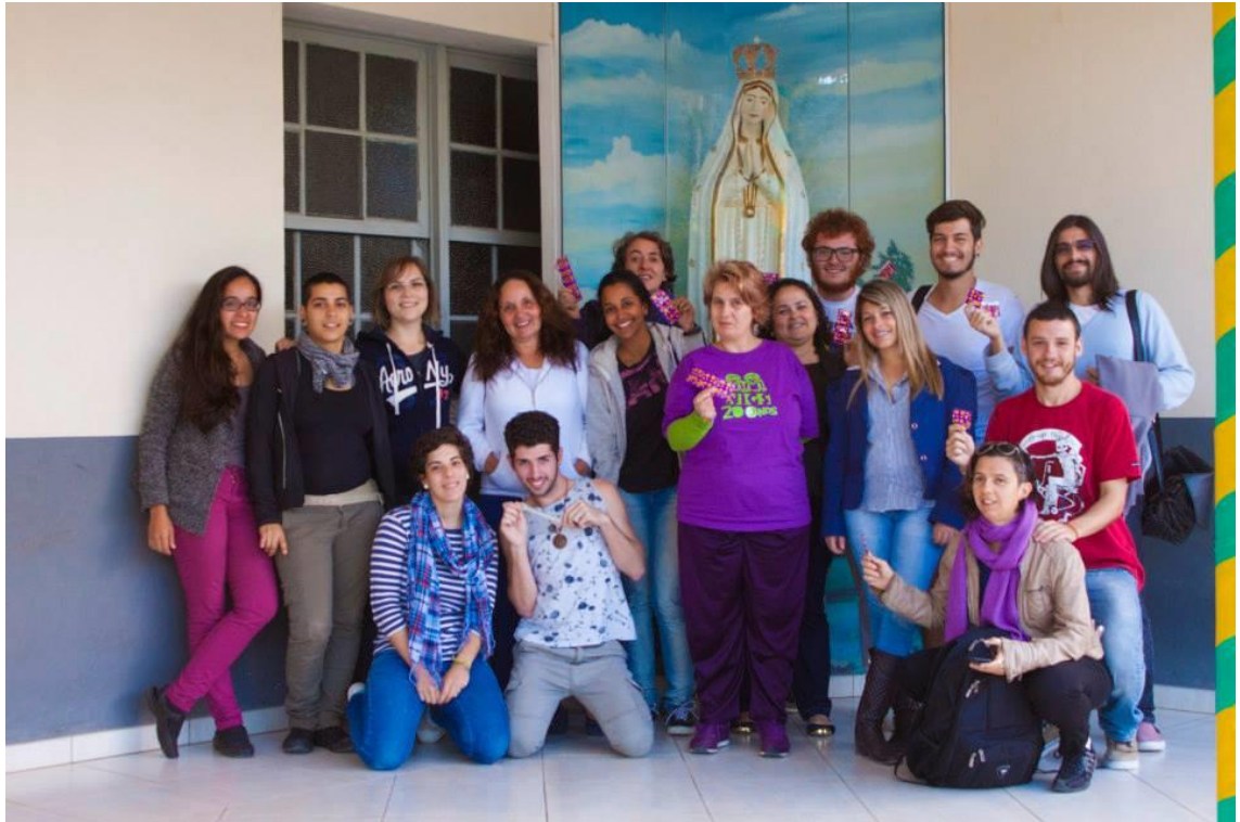
IMAGEM 3 Bolsistas PIBIC EM