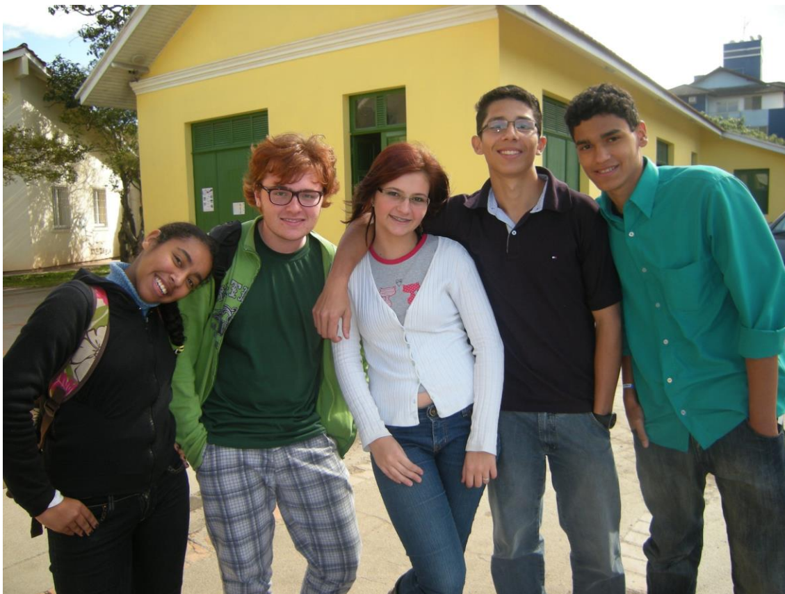
IMAGEM 1 Equipe Papo Sérió em Oficinas em setembro de 2013

estudantes do Ensino Fundamental e Médio, com o intuito de estimular a criação de espaços para formação de estudantes, incluindo temas transversais ao cotidiano escolar.